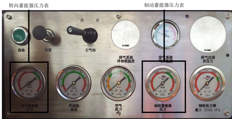
驾驶室右侧控制面板